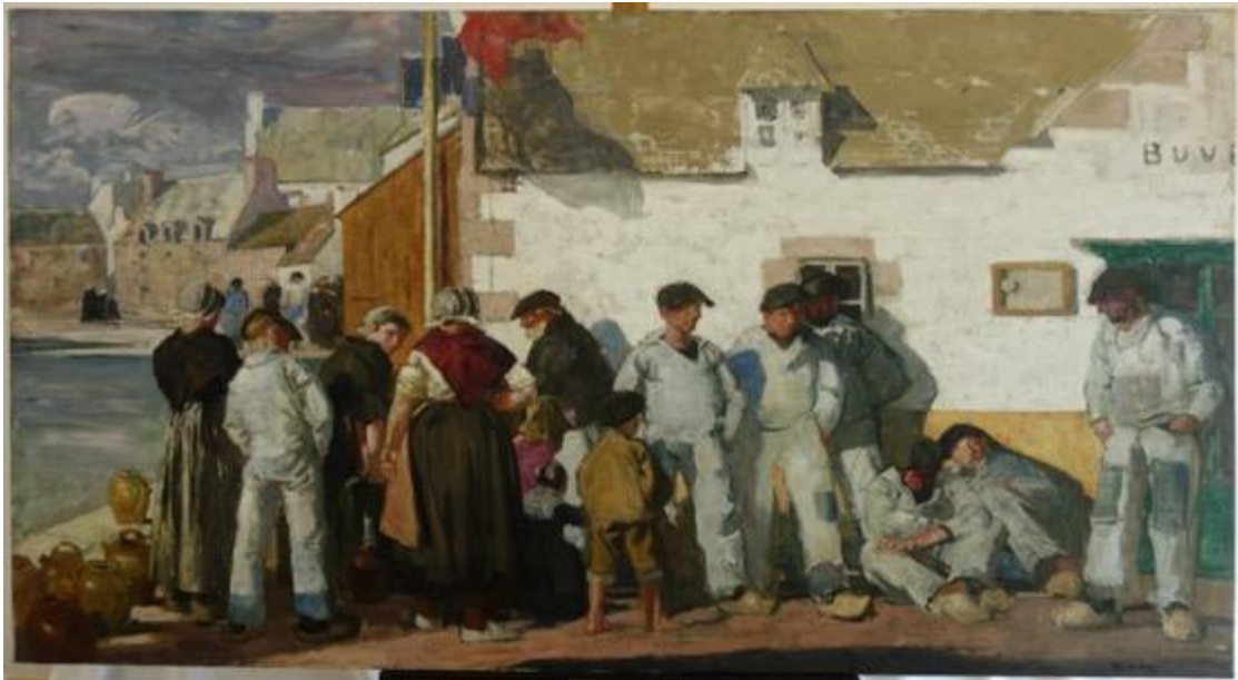
1920 – La Fontaine sur les quais de l'Île-Tudy , Huile sur toile, 104 x 196, collection particulière (Page 93 dans le Cahier Lucien Simon N°3)

L'Association Lucien Simon est très encouragée à chaque fois qu'une œuvre de Lucien Simon est restaurée. Nous remercions les propriétaires de participer ainsi à la sauvegarde de l'œuvre de Lucien Simon et bien sûr nous saluons aussi le travail de la restauratrice.