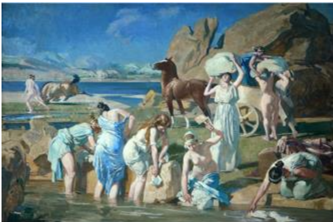
1915 – Nausicaa ou Nausicaa à la Fontaine , Huile sur toile, 198x 280cm, Musée du Petit-Palais, Paris (Page 115 dans le Cahier Lucien Simon N°3)

Le Petit Palais propose des activités en ligne pour toute la famille comme réaliser un dessin ou un objet d'après les collections et découvrir les correspondances entre œuvres et grands textes.